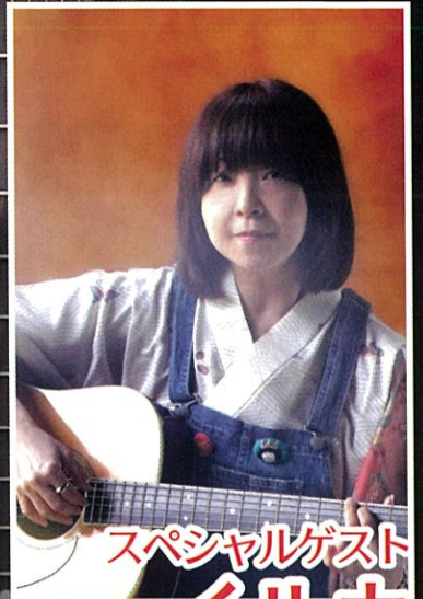
スペシャルゲスト イルカ